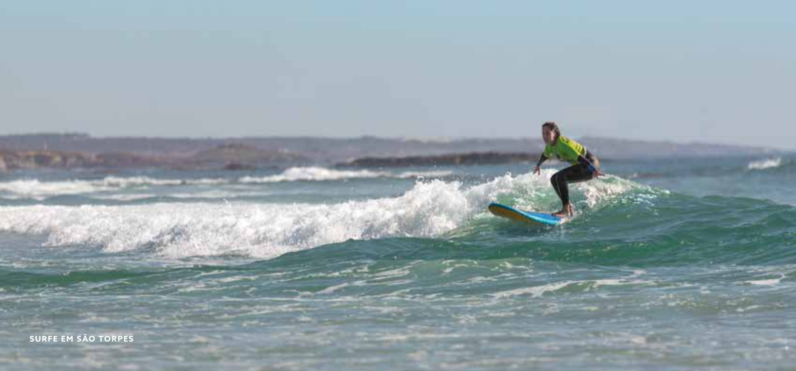
SURFE EM SÃO TORPES