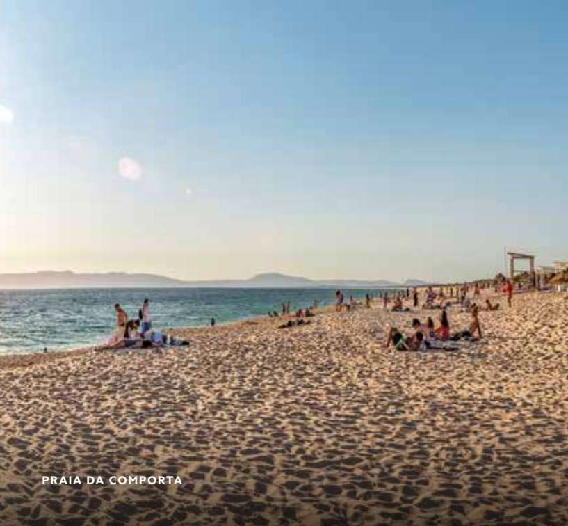
PRAIA DA COMPORTA