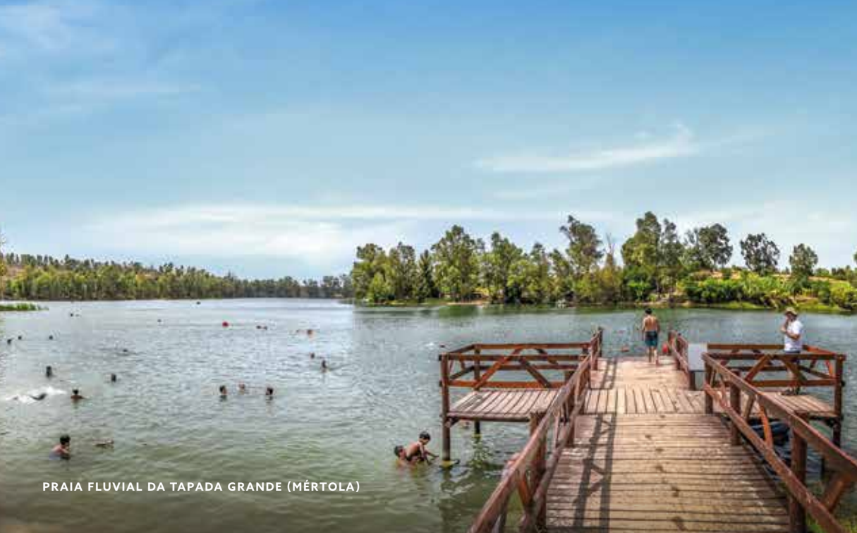
PRAIA FLUVIAL DA TAPADA GRANDE (MÉRTOLA)