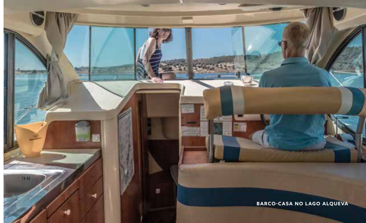
BARCO-CASA NO LAGO ALQUEVA