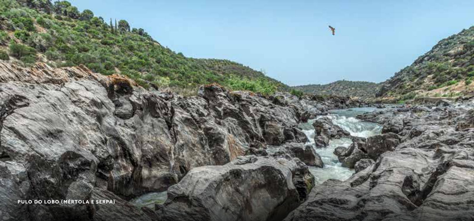
PULO DO LOBO (MÉRTOLA E SERPA)