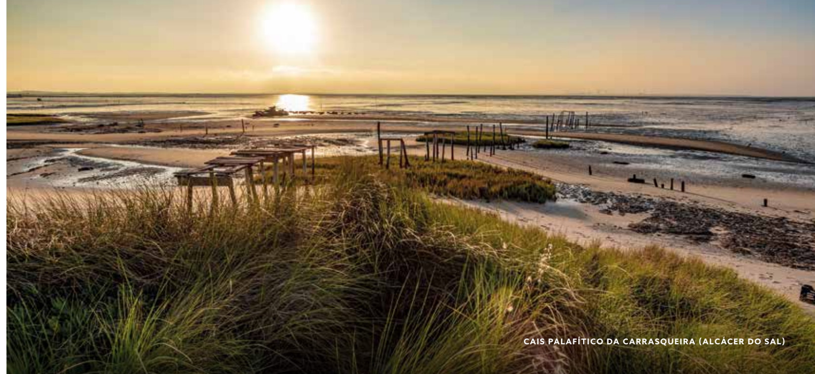
CAIS PALAFÍTICO DA CARRASQUEIRA (ALCÁCER DO SAL)