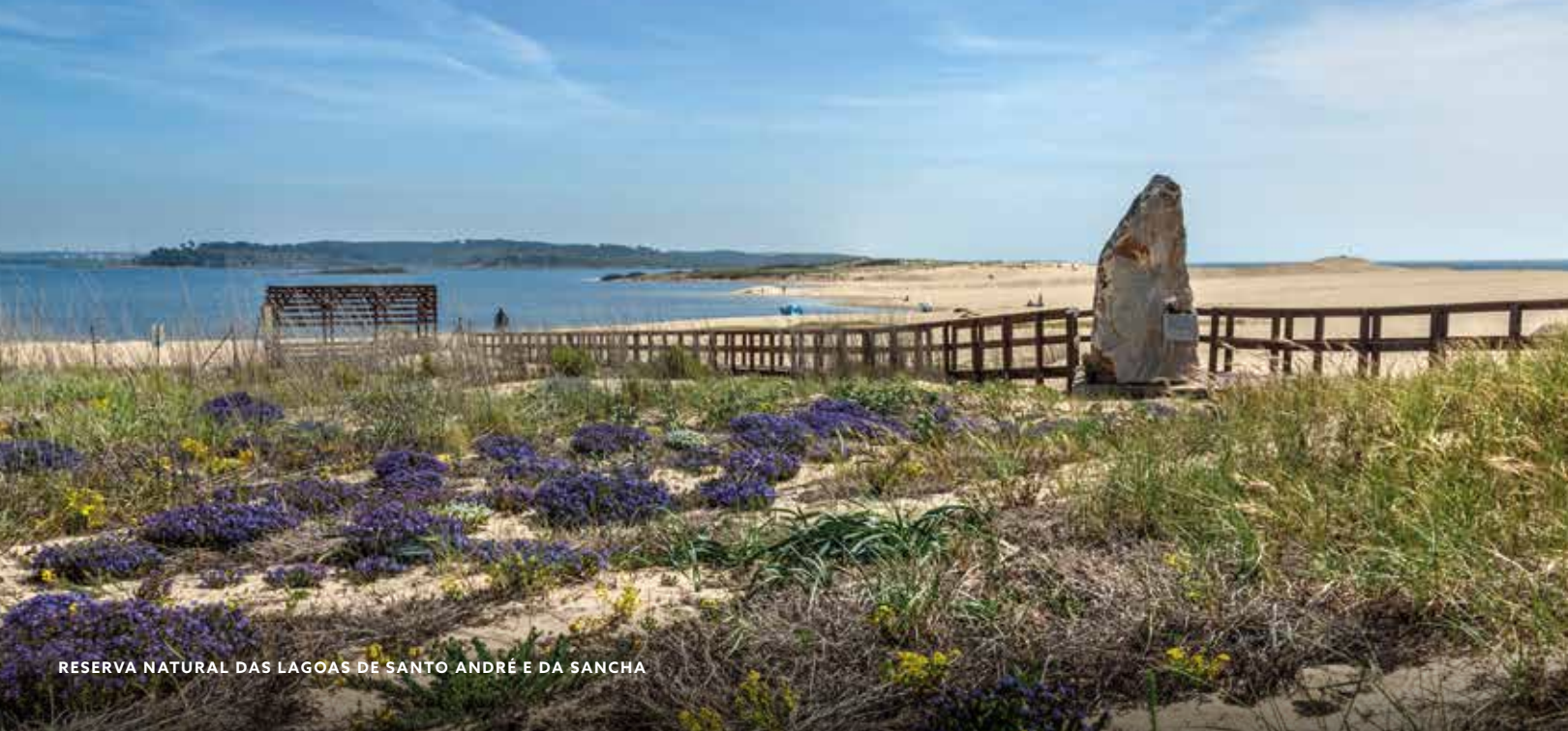
RESERVA NATURAL DAS LAGOAS DE SANTO ANDRÉ E DA SANCHA