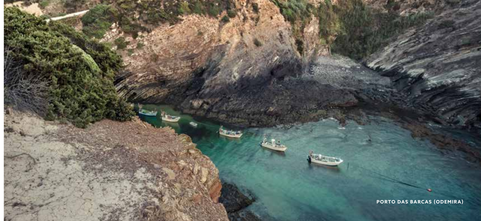
PORTO DAS BARCAS (ODEMIRA)

Um parque que abrange mais de 100 quilômetros da costa portuguesa, em um trecho de litoral que é um dos mais preservados de toda a Europa. Sua paisagem marcante, repleta de falésias e do azul profundo do mar, é lar de fauna e flora raras. Basta ter atenção para encontrar animais como a cegonha-branca e a graciosa lontra. As boas ondas são garantidas para surfistas.