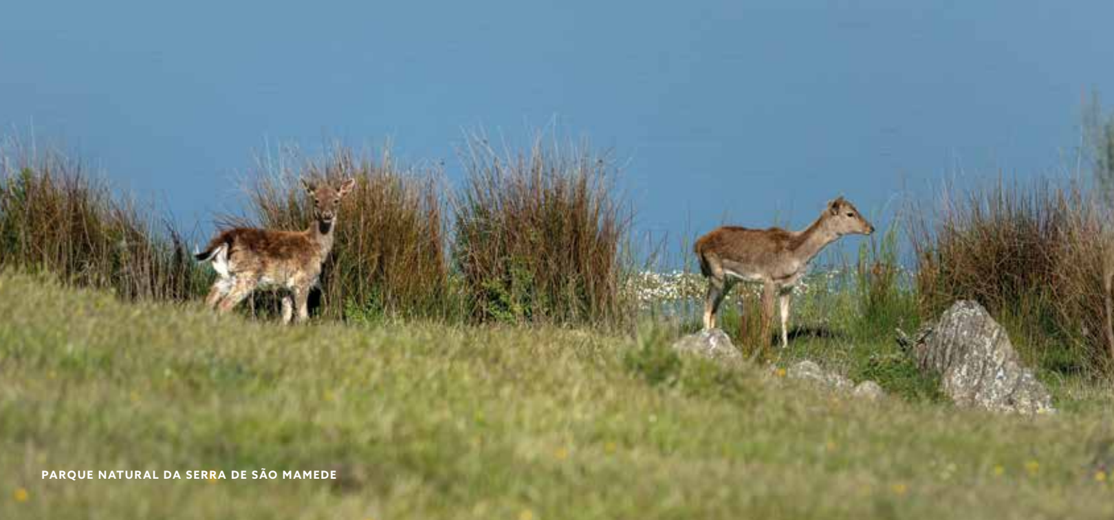
PARQUE NATURAL DA SERRA DE SÃO MAMEDE