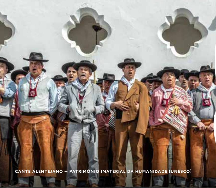
CANTE ALENTEJANO – PATRIMÔNIO IMATERIAL DA HUMANIDADE (UNESCO)