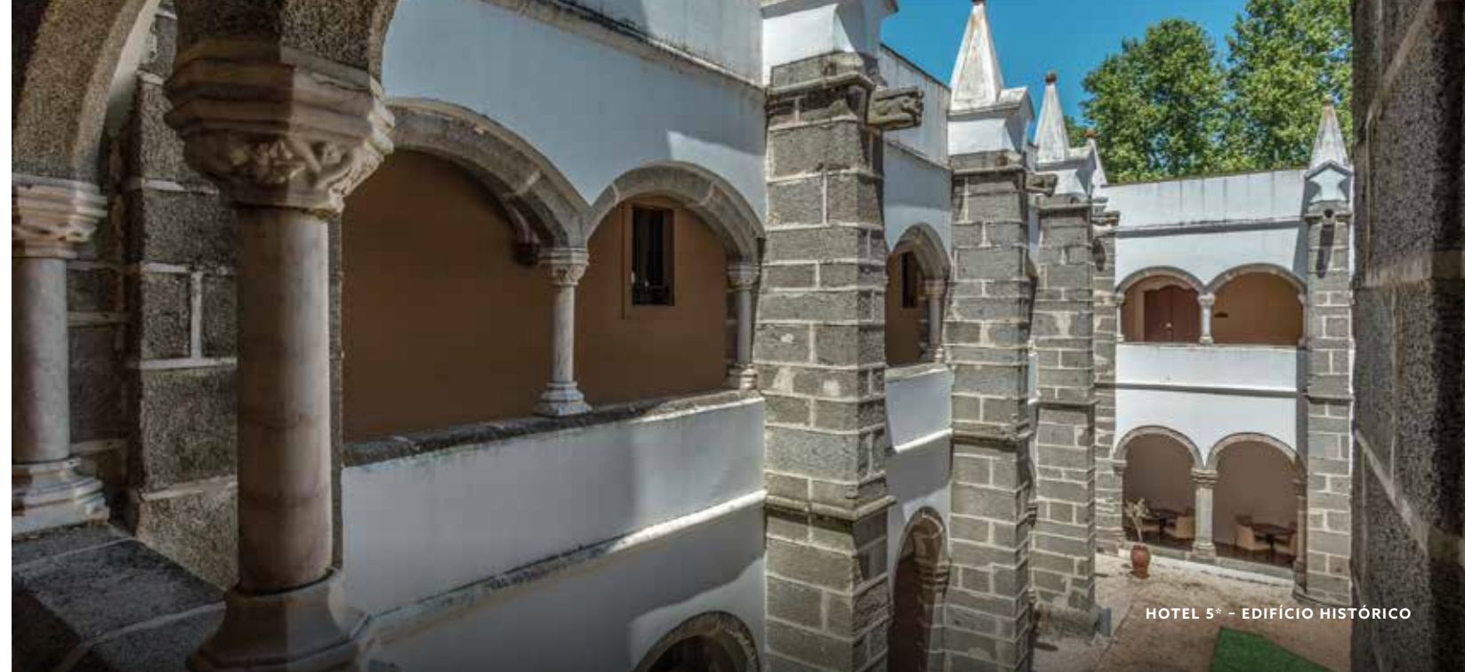
HOTEL 5* - EDIFÍCIO HISTÓRICO

Hospedar-se em um castelo, convento ou antigo palacete nos destinos mais charmosos do Alentejo promete ser uma experiência inesquecível.