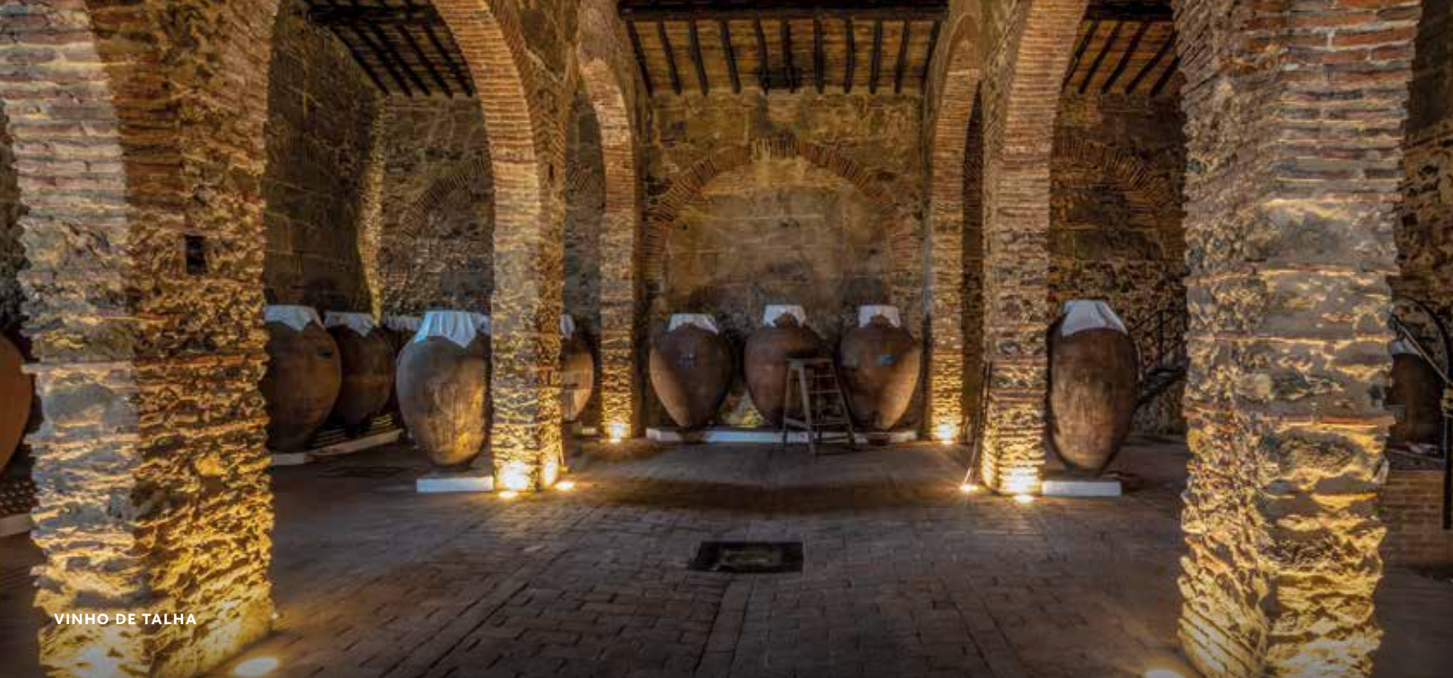
VINHO DE TALHA

Foi com as grandes navegações e o Renascimento que se construíram igrejas, palácios imponentes, conventos e aquedutos que sobreviveram à ação do tempo. Alguns desses lugares tornaram-se hotéis ou restaurantes, levando os viajantes não apenas a ver de perto a arquitetura centenária e refinada, mas a viver como a própria realeza vivia.