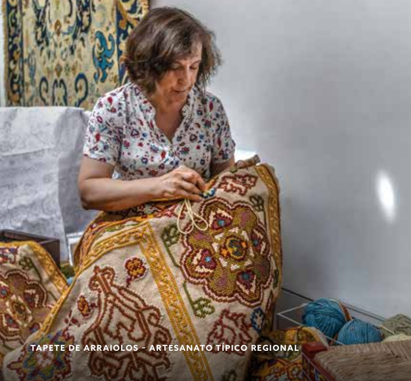
TAPETE DE ARRAIOLOS - ARTESANATO TÍPICO REGIONAL