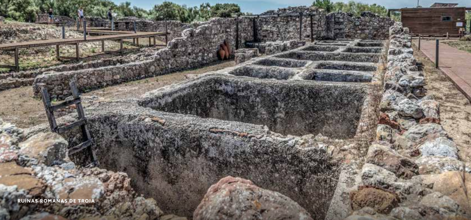
RUÍNAS ROMANAS DE TROIA