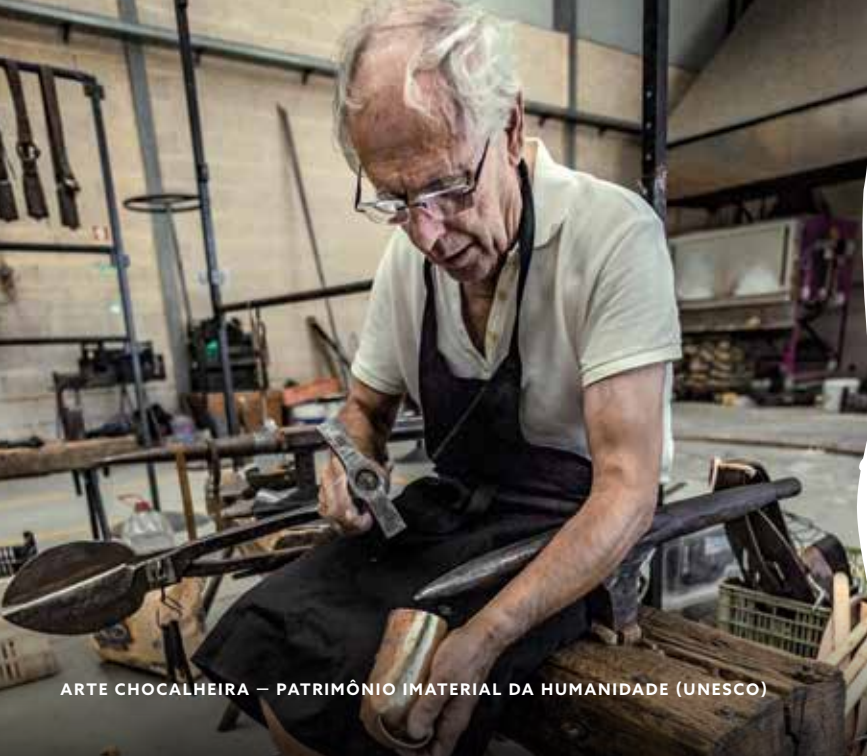
ARTE CHOCALHEIRA – PATRIMÔNIO IMATERIAL DA HUMANIDADE (UNESCO)