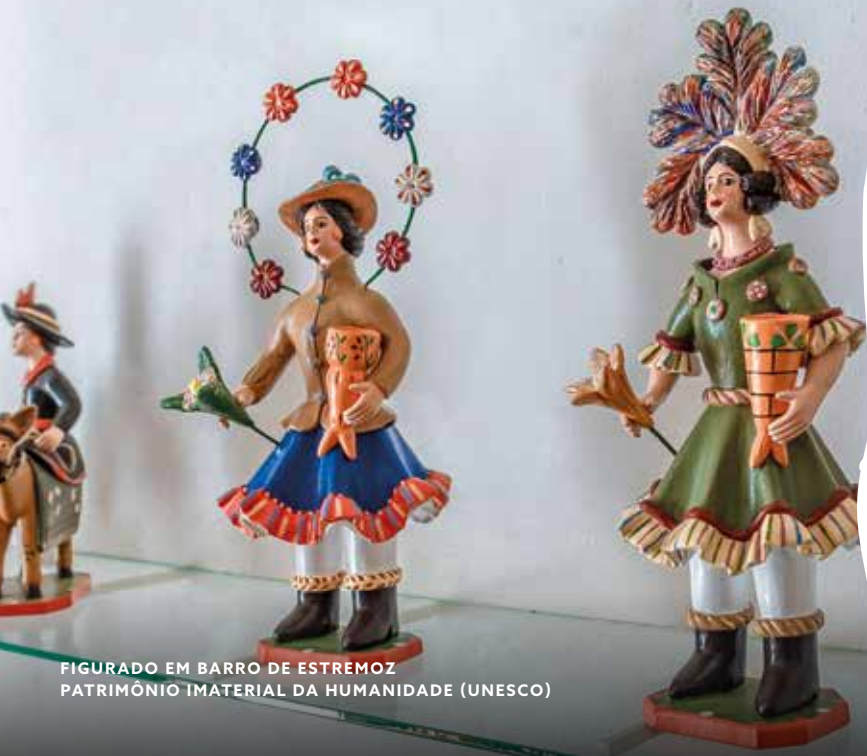
FIGURADO EM BARRO DE ESTREMOZ PATRIMÔNIO IMATERIAL DA HUMANIDADE (UNESCO)