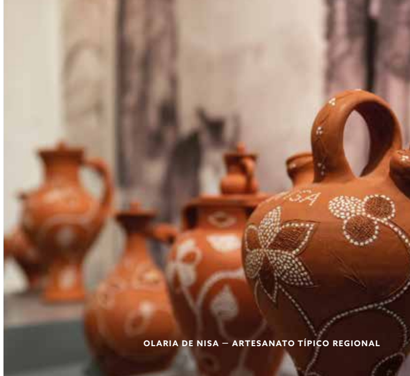
OLARIA DE NISA — ARTESANATO TÍPICO REGIONAL

E, em várias cidades e vilas do Alentejo, há a charmosa mobília pintada com desenhos diversos.