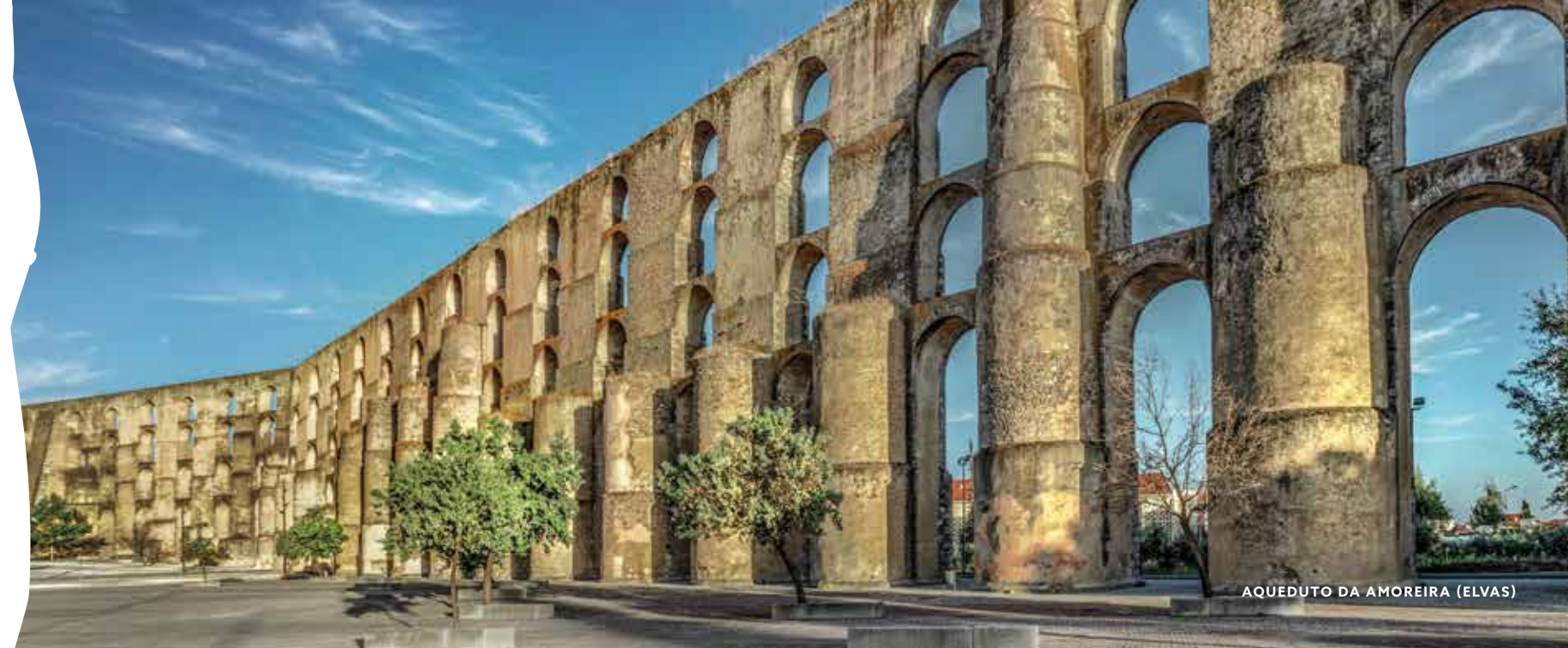
AQUEDUTO DA AMOREIRA (ELVAS)

Esta verdadeira obra-prima da arquitetura militar é parte de uma estrutura defensiva em forma de estrela com um perímetro de dez quilômetros, que se une ao Forte de Santa Luzia e diversos outros fortins, formando a maior fortificação abaluartada do mundo. Junto com o castelo e o deslumbrante Aqueduto da Amoreira, com cerca de sete quilômetros de extensão, deu a esta cidade-fortaleza o título de Patrimônio Mundial da Humanidade da UNESCO.