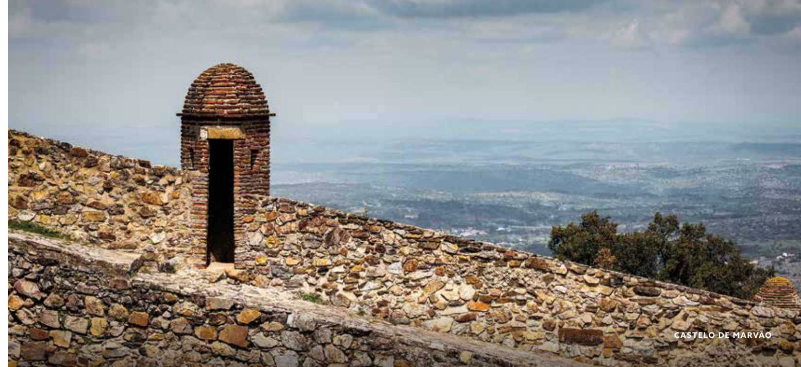
CASTELO DE MARVÃO

Tais construções vivem até hoje, com suas muralhas e torres, posicionadas sobre morros que garantem algumas das mais belas vistas da região. Elvas é a cidade onde melhor se pode admirar as estruturas defensivas da época.