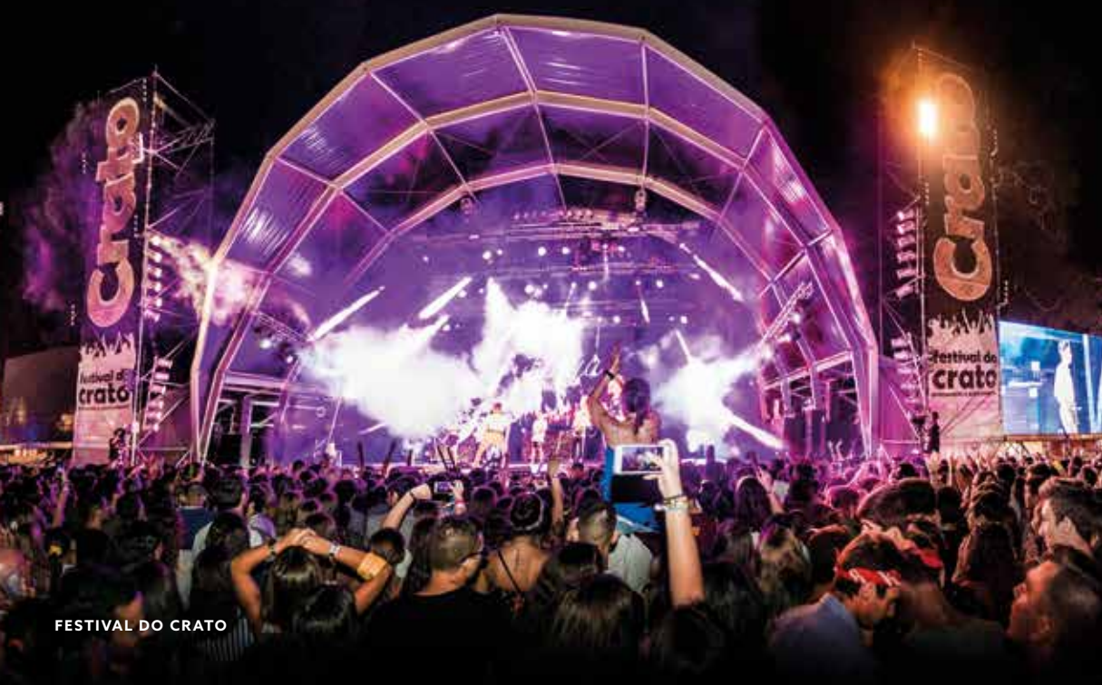
FESTIVAL DO CRATO