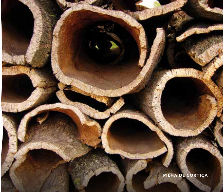
PILHA DE CORTIÇA