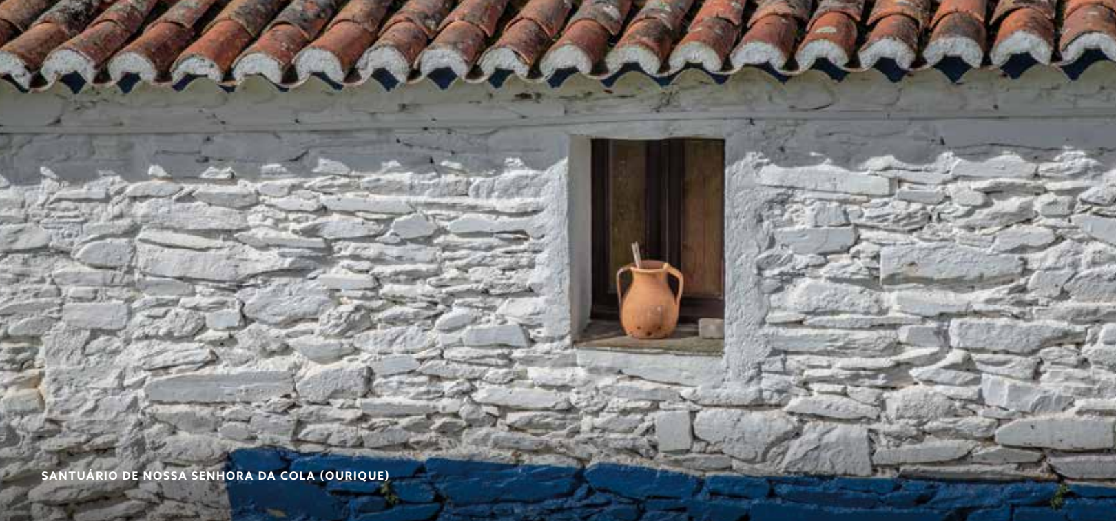
SANTUÁRIO DE NOSSA SENHORA DA COLA (OURIQUE)