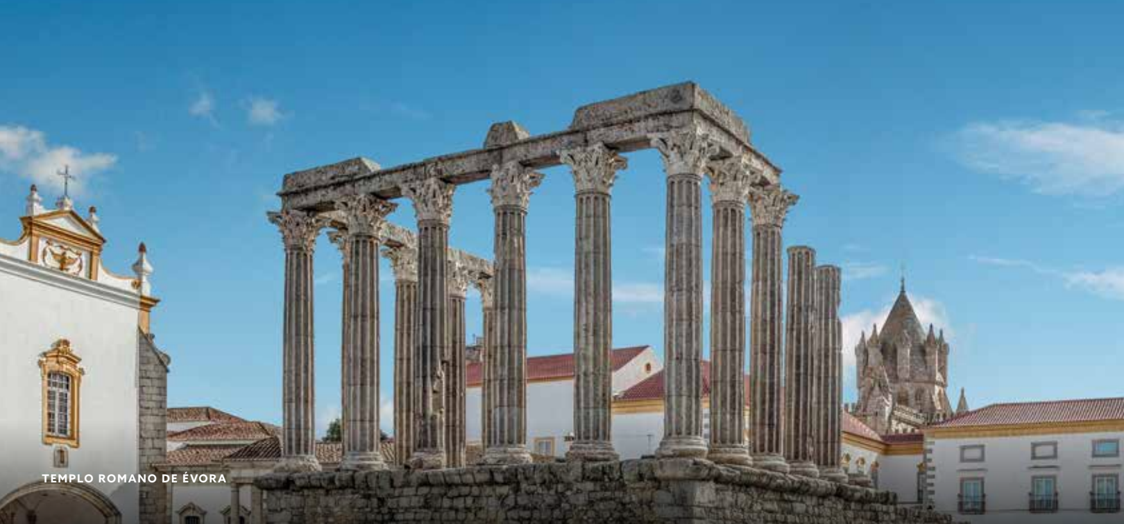
TEMPLO ROMANO DE ÉVORA